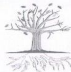
Ключевые (корневые) причины

Проводится расследование с составлением отчетов о расследовании, разработкой мероприятий по недопущению возникновения аналогичных происшествий в Обществе и оформлением извлеченных уроков.